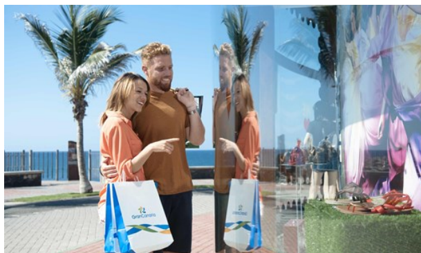
Gran Canaria Tourist Board

Det finns fyra inriktningar av shopping på Gran Canaria: souvenirköp, flanerande på huvudgatan, kringströvande i köpcentret och köpslående på den lokala marknaden. Vad du än vill ha i din korg, kan du hitta det på ön. Den högsta koncentrationen av affärer för turisternas behov finns i fyrvåningsbyggnaden Yumbo Centre i Maspalomas, med fler än 200 affärer som säljer