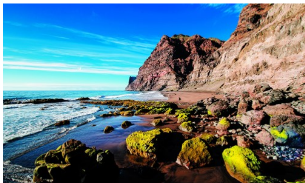
Gran Canaria Tourist Board

De flesta nya besökare på Gran Canaria lockas till den gyllene södern vars sandiga bukter, fiskehamnar och små vikar ger den sololjeglänsande folkmassan ett rikt urval av möjligheter till strandliv. Här är de böljande dynerna vid Maspalomas det enda naturliga inslaget bland de bullrande badorterna som människan konstruerat på Playa del Ingles och Playa de Maspalomas. Längre bort på kusten är det Puerto Rico och Puerto de Mogán som lockar sanddyrkarna, sistnämnda ort är också ett naturskönt strandhugg för yachtfolket.