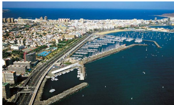
Gran Canaria Tourist Board