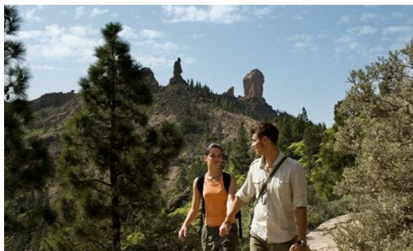
Gran Canaria Tourist Board

Om du gillar mildt klimat, massor av sevärdheter och omväxlande landskap kan miniatyrkontinenten Kanarieöarna vara helt rätt för dig.