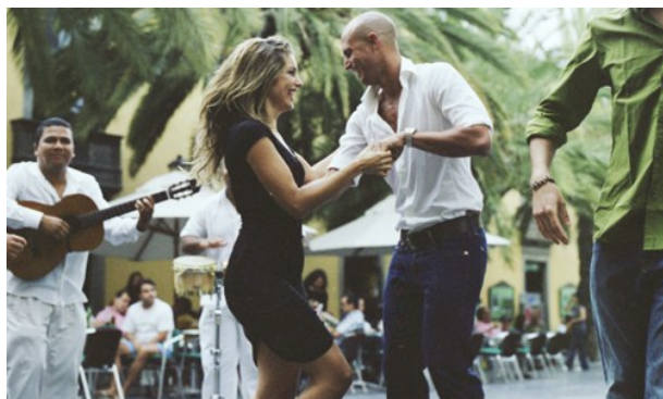
Gran Canaria Tourist Board

Nattlivet på Gran Canaria är livligt, färgstarkt och spännande. Maspalomas och Playa del Ingles är de hetaste partyställena. Det börjar efter midnatt och fortsätter fram till soluppgången, de flesta barerna har öppet till kl. 02.00 och nattklubbar håller vanligtvis öppet till kl. 06.00. Mycket lite händer innan midnatt. Yumbo köpcentrum är där det mesta händer, där en blandad skara festglada samlas från solnedgång till soluppgång.