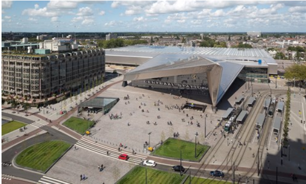
Ossip van Duivenbode